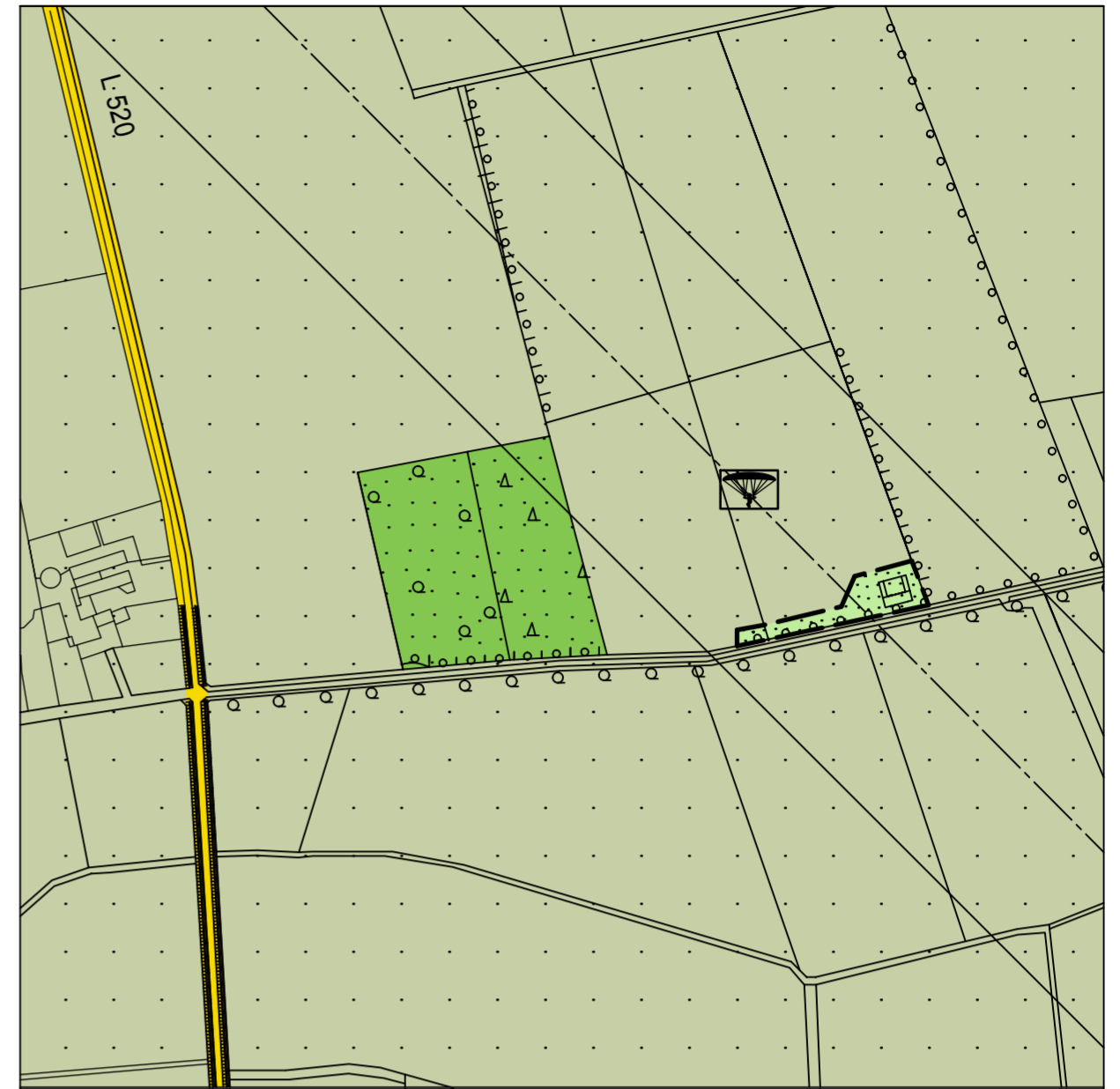
Darstellung gemäß § 5 (2) BauGB