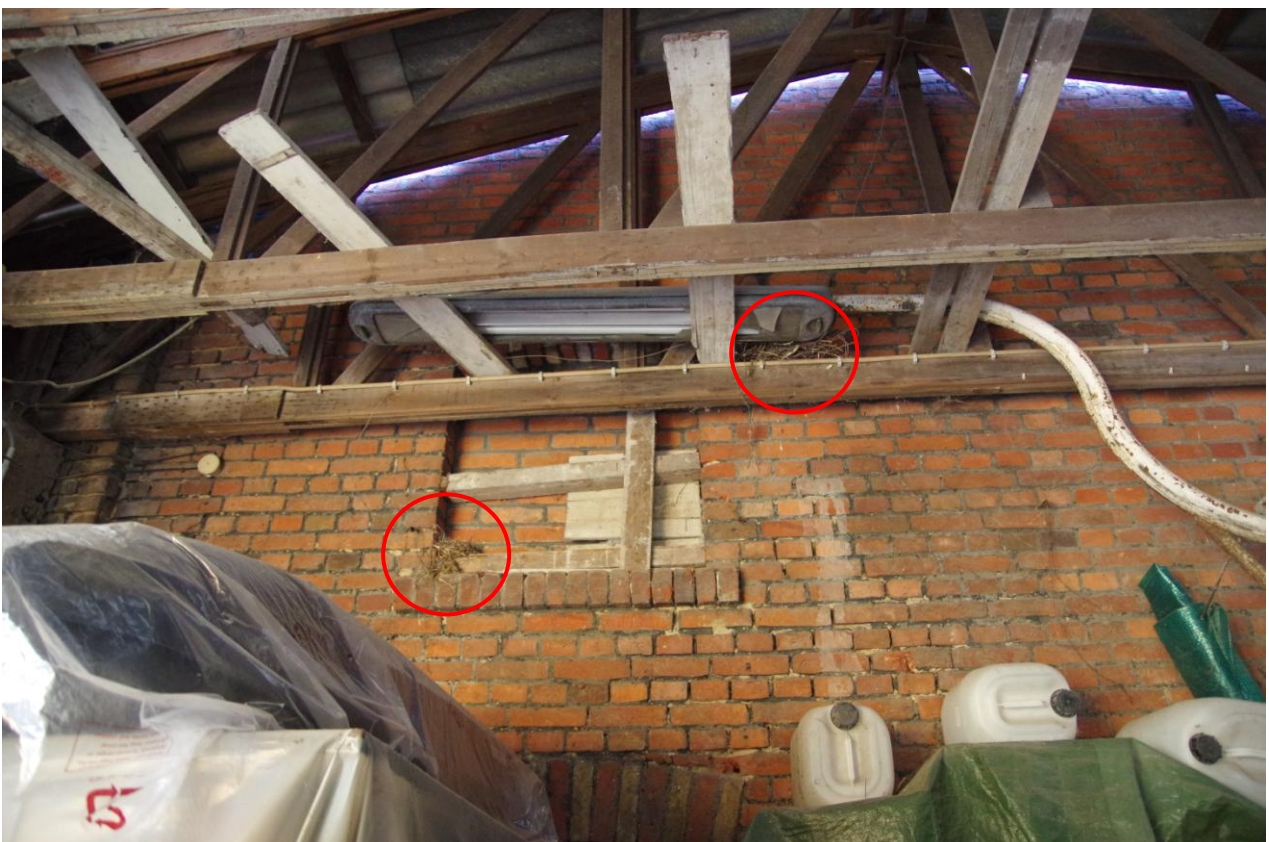
Abbildung 4: Zwei leere Nester (rote Markierung) im Übergang von Lagerhalle und dem benachbarten Gebäude.