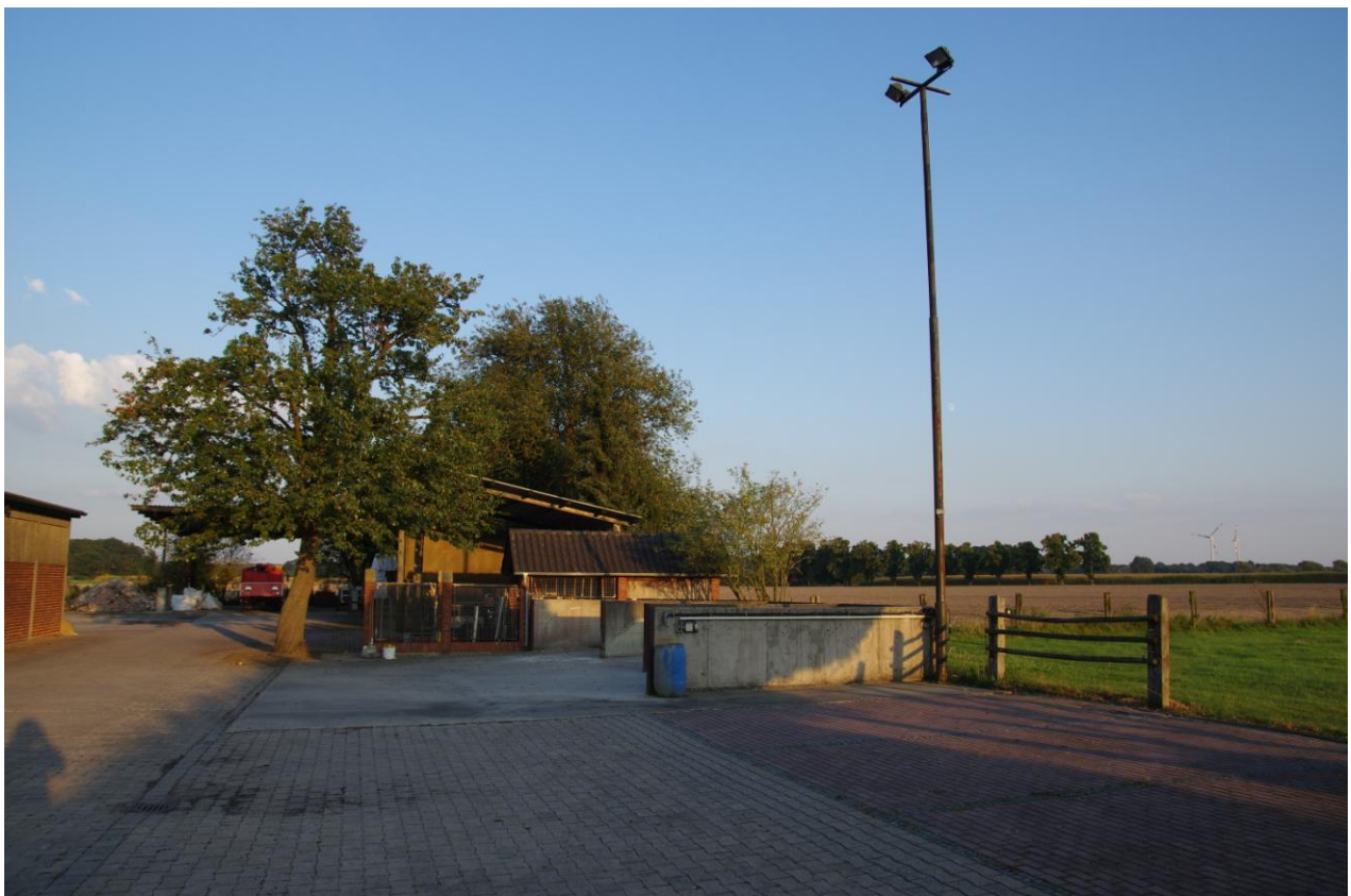
Abbildung 2: Geplantes Baufeld zur Errichtung einer Kindertagespflegeeinrichtung im südlichen Teil des Plangebietes.