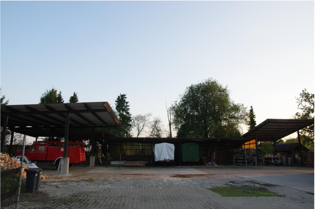
Abbildung 5: Mehrere Remisen und Gehölzaufwuchs im östlichen Teil des Plangebietes.