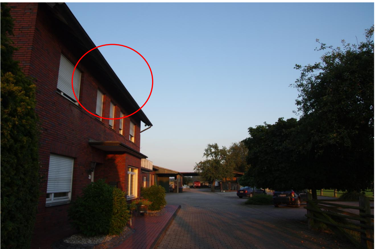
Abbildung 6: An der Südseite des Gebäudes Rohrlandweg 27 befindet sich eine kleine Mehlschwalbenkolonie (rote Markierung).