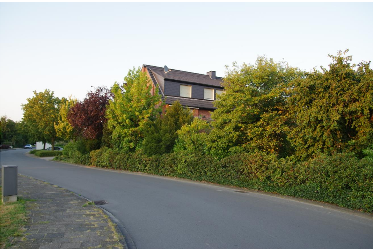
Abbildung 8: Westrand des Plangebietes entlang des Rohrlandweges.