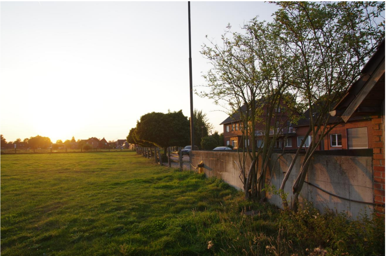
Abbildung 7: Grünland im Bereich des geplanten Neubaus einer Kindertagespflegereinrichtung.