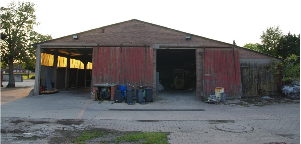
Abbildung 3: Ehemalige Lagerhalle eines Baubetriebes im östlichen Plangebiet.