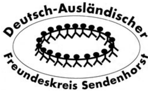
Der Deutsch-Ausländische Freundeskreis e.V. (DAF)

Der DAF hält mehrere Angebote für Geflüchtete vor.